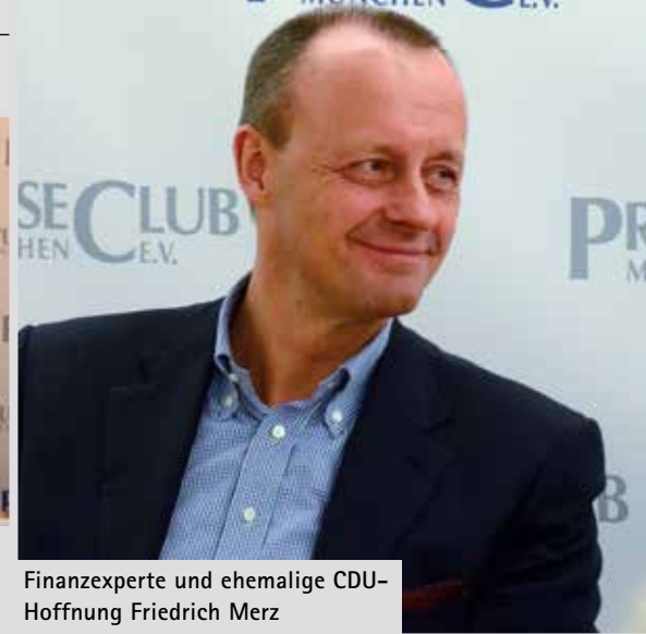
Finanzexperte und ehemalige CDU-Hoffnung Friedrich Merz