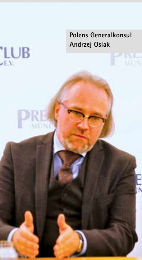
Polens Generalkonsul Andrzej Osiak