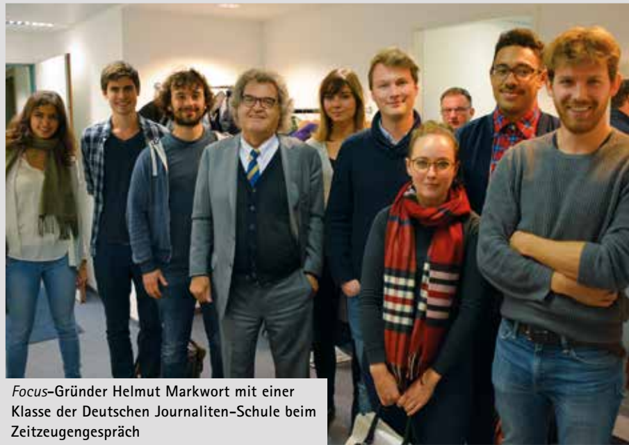
Focus-Gründer Helmut Markwort mit einer Klasse der Deutschen Journaliten-Schule beim Zeitzeugengespräch