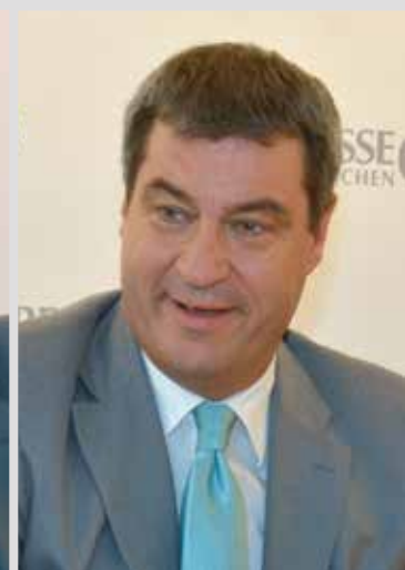
Finanz- und Heimatminister Markus Söder