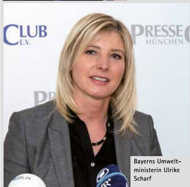
Bayerns Umwelt- ministerin Ulrike Scharf