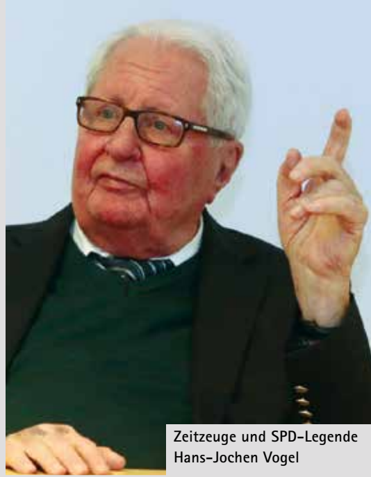
Zeitzeuge und SPD-Legende Hans-Jochen Vogel