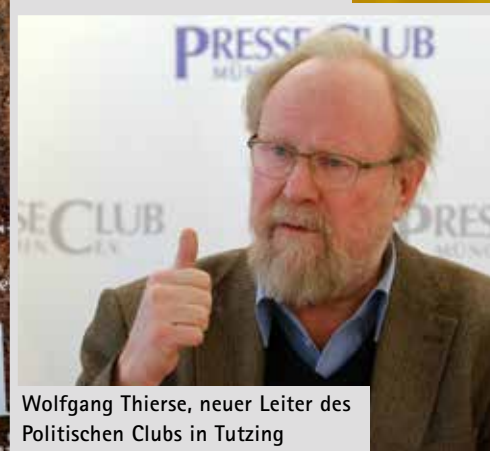
Wolfgang Thierse, neuer Leiter des Politischen Clubs in Tutzing