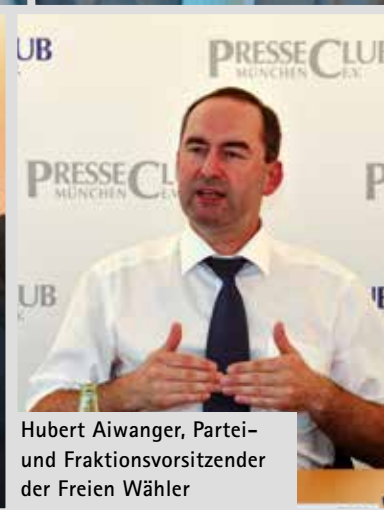
Hubert Aiwanger, Partei- und Fraktionsvorsitzender der Freien Wähler