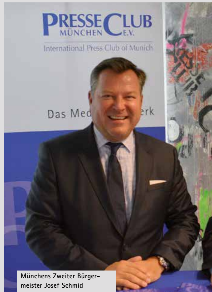
Münchens Zweiter Bürgermeister Josef Schmid