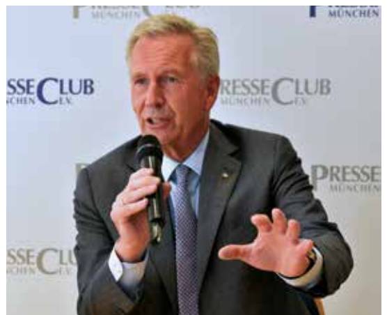
2024 Bundespräsident a. D. Christian Wulff diskutiert über Demokratie und Populismus.