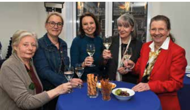
2023 Austausch unter Medienschaffenden beim neuen Format PresseClub Afterwork.

Eine Königin im PresseClub: Der Besuch I.M. Königin Silvia von Schweden ist sicherlich das Highlight in diesem Jahrzehnt. Und auch sonst passiert sehr viel. Der Förderverein des PresseClub München wird gegründet und 2025 das 75. Jubiläum gefeiert.