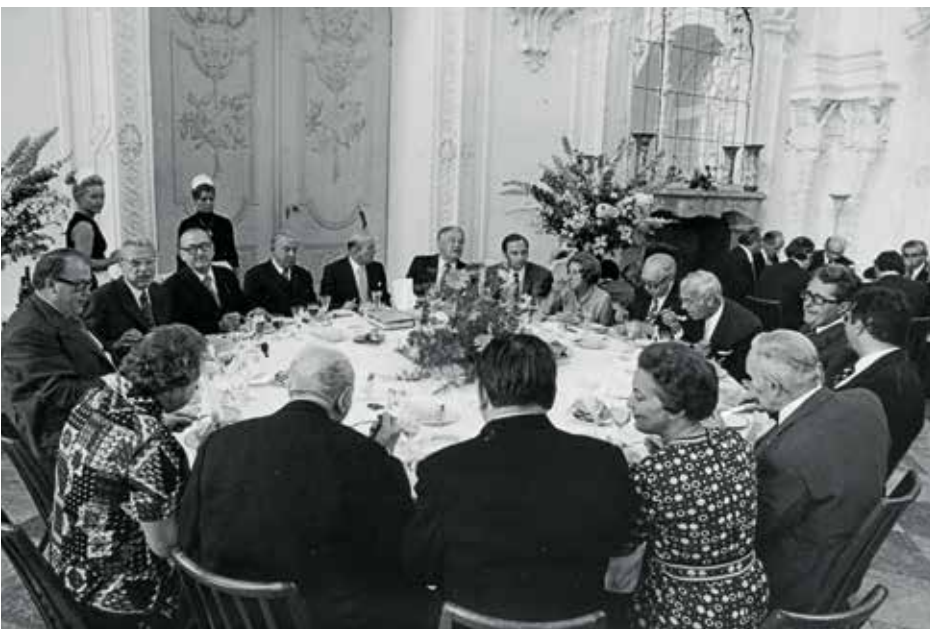
1973 Jahresessen im Schloss Schleißheim.