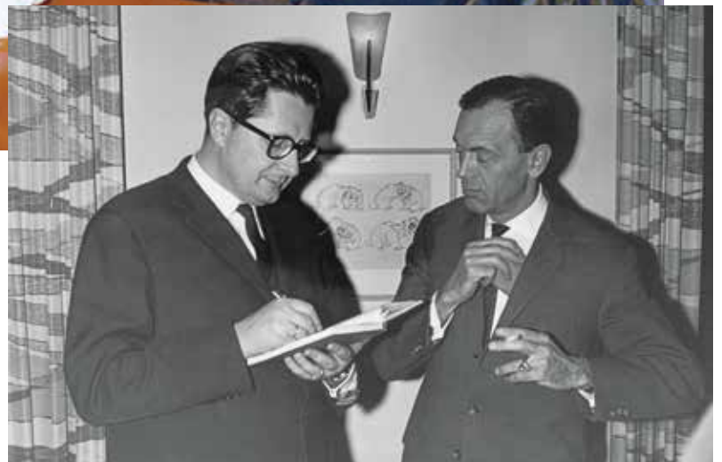
1983 Frisch wiedergewählt: Münchens Oberbürgermeister Dr. Hans Jochen Vogel (links).