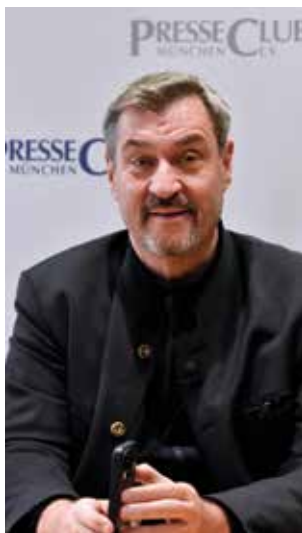
2025 Kein Jahr ohne Besuch des bayerischen Ministerpräsidenten: Dr. Markus Söder auf dem Podium.