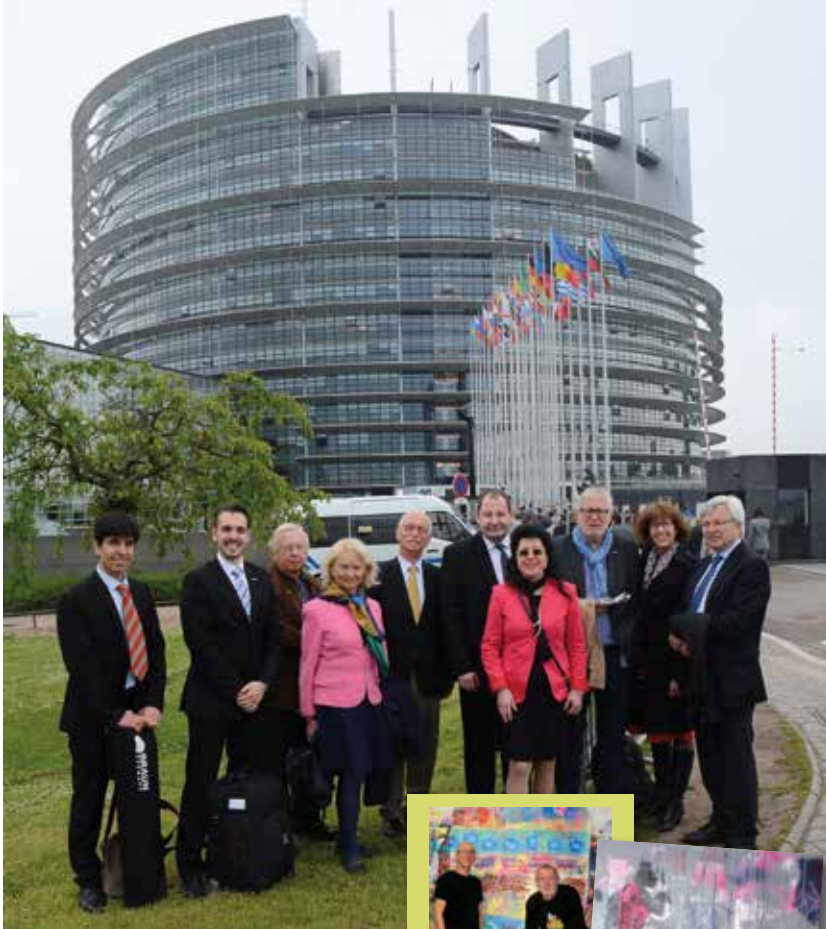
2016 48 Stunden Straßburg: Informationsfahrt des PresseClubs ins Europäische Parlament.