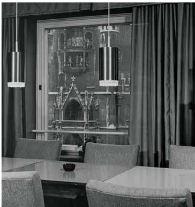
1958 Eine Stätte der Begegnung: In den Lese- und Besprechungsräumen wurde lebhaft diskutiert, geschrieben und ab und zu auch einen Blick auf die markante Fassade des gegenüberliegenden Rathauses geworfen.