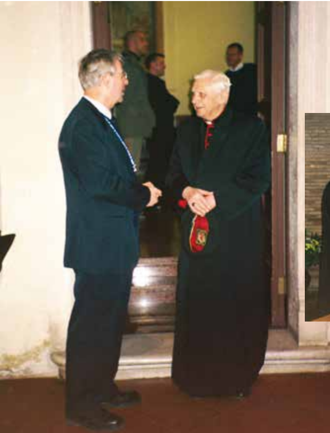
2003 In Rom: Eine Delegation des Presse-Clubs besucht Kardinal Joseph Ratzinger. Zwei Jahre später wird er zum Papst gewählt.