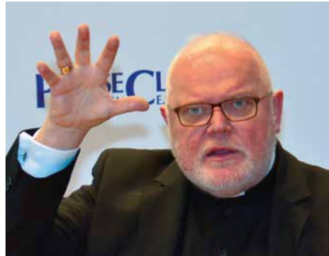
2015 Kardinal Reinhard Marx beim Jahresgespräch im Club.