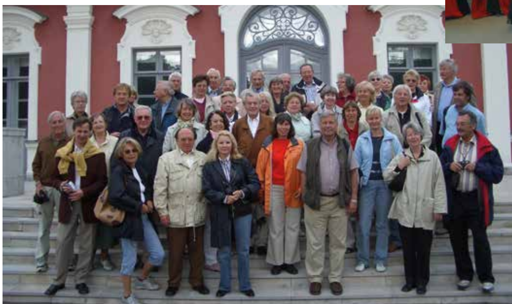
2005 50 Clubmitglieder reisen ins Baltikum. Litauen, Lettland und Estland stehen auf ihrer Route. Hier zu sehen vor dem barocken Schloss in Reval.