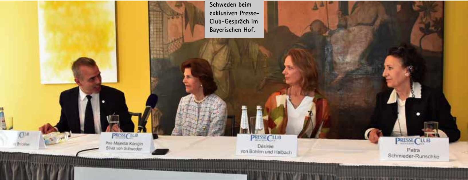
Ihre Majestät Königin Silvia von Schweden beim exklusiven Presse-Club-Gespräch im Bayerischen Hof.