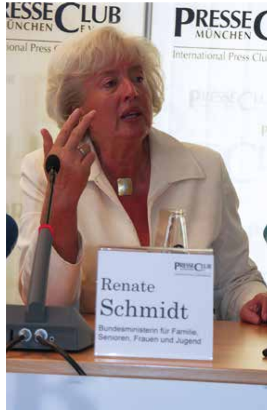
2004 Bundesministerin Renate Schmidt für Familie, Senioren, Frauen und Jugend ist zu Gast.