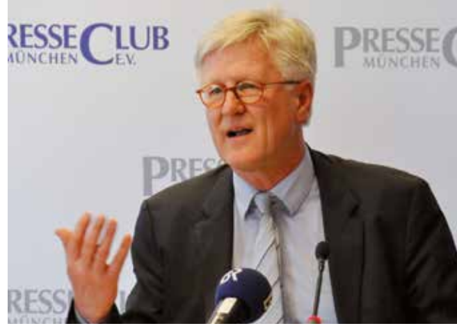
2014 Gespräche mit Tradition: Einmal im Jahr ist der evangelische Landesbischof zu Gast, hier Heinrich Bedford-Strohm.