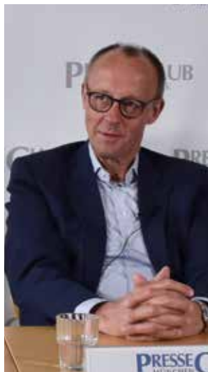
2024 Friedrich Merz – hier noch kein Kanzler – bei einer Hintergrunddiskussion im PresseClub.