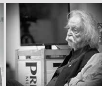
TELI-Jour-fixe: „ÜberLeben – Der Planet denkt um“ – Zum Jahresauftakt 2025 diskutiert die Journalistenvereinigung TELI mit dem Wissenschaftsjournalisten Tilman Steiner. Auch dabei: Ehrengast Jean Pütz.