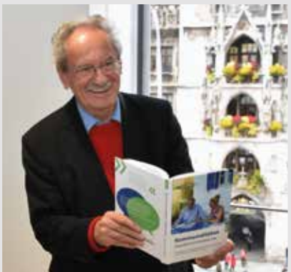
Münchens Alt-OB und PresseClub-Ehrenmitglied Christian Ude feiert seinen 77. Geburtstag. Und stellt das neueste Buch über sein politisches Leben vor.