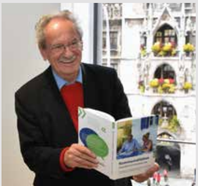
Münchens Alt-OB und PresseClub-Ehrenmitglied Christian Ude feiert seinen 77. Geburtstag. Und stellt das neueste Buch über sein politisches Leben vor.